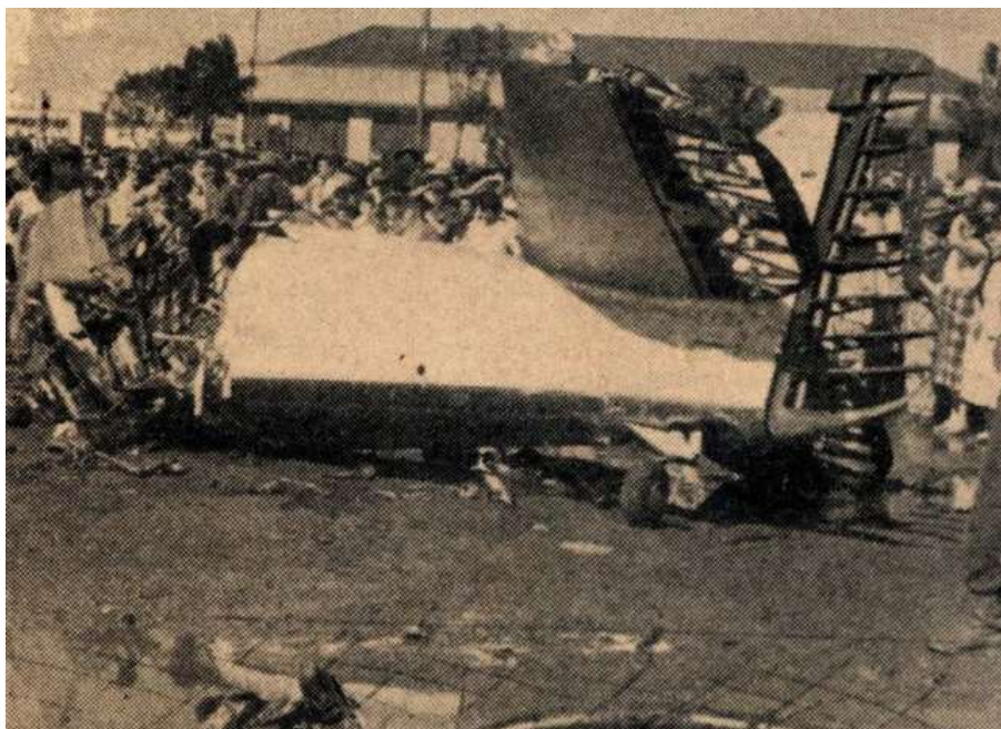
Figura – Queda do avião