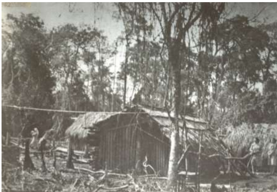
Figura – Primeiros ranchos de Maringá