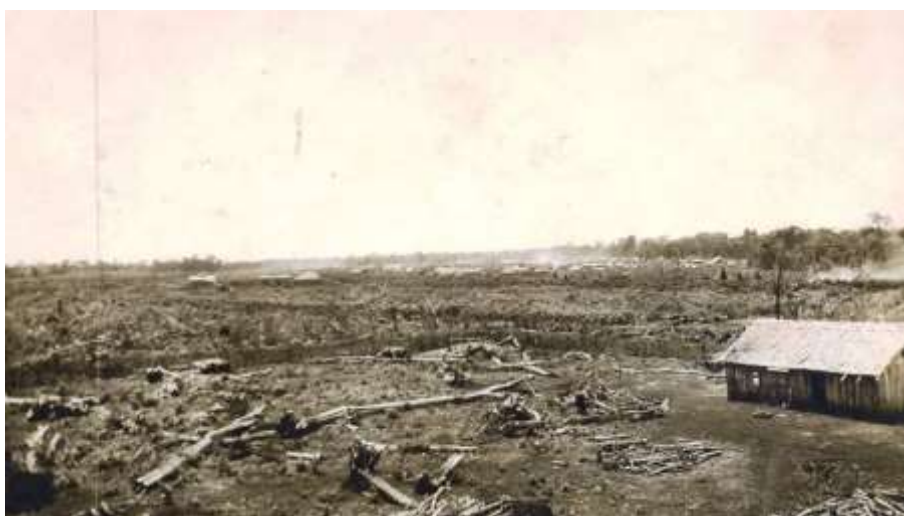
Figura – Primeiros ranchos de Maringá