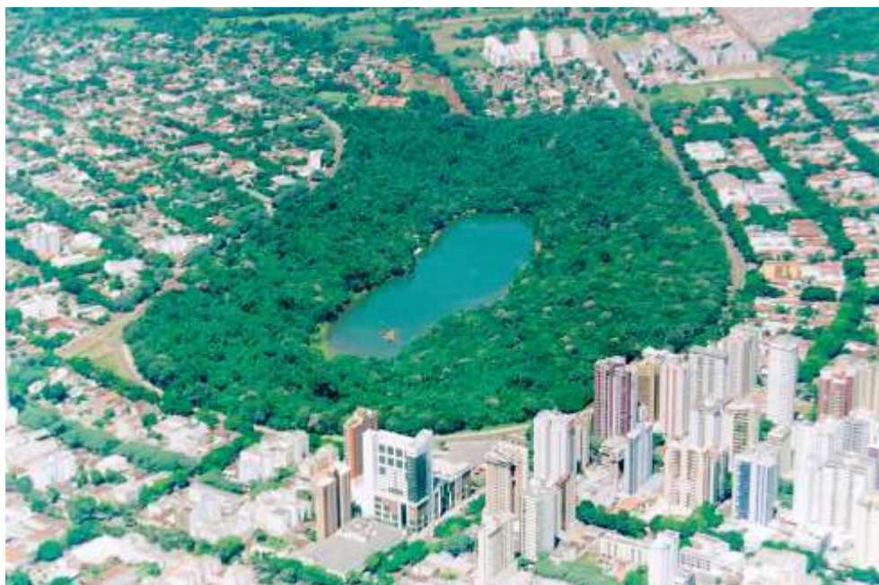
Figura – Imagem Parque do Ingá- Contornos Vila Operária

A foto abaixo demonstra os contornos da Vila Operária nos dias atuais: