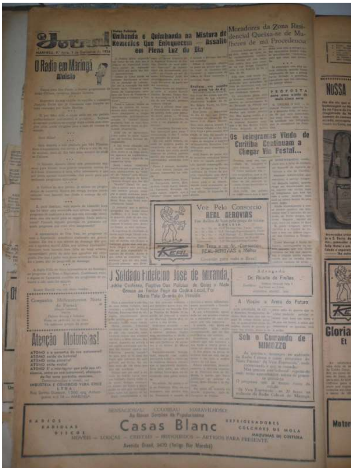
Figura – Jornal O Povo-Reportagem sobre os “curandeiros” nordestinos

Embora não exista a citação direta sobre o envolvimento dos nordestinos com as práticas religiosas, a reportagem em tom “denuncista” proliferava pela cidade os boatos que relacionavam os nordestinos as práticas de religiões afrodescendentes e a