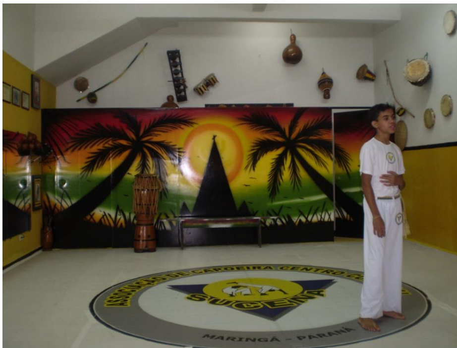
Figura 1. Esta foto foi tirada após as pinturas terminadas. No chão pode-se perceber a imagem que representa o grupo e delimita o espaço de jogo da roda.

Neste dia, o mestre mandou fazer uma roda na calçada, pois dentro da sala onde ocorrem os treinos e a roda estava com um cheiro forte de tinta, devido a algumas reformas que estavam ocorrendo no local, como por exemplo, a pintura das paredes e do chão onde tem um enorme desenho, o qual representa o grupo e determina o tamanho da roda. O desenho é o mesmo símbolo que está na parte frontal e posterior das camisetas do grupo, uma de suas identificações. A seguir apresento uma foto que elucida a descrição feita.