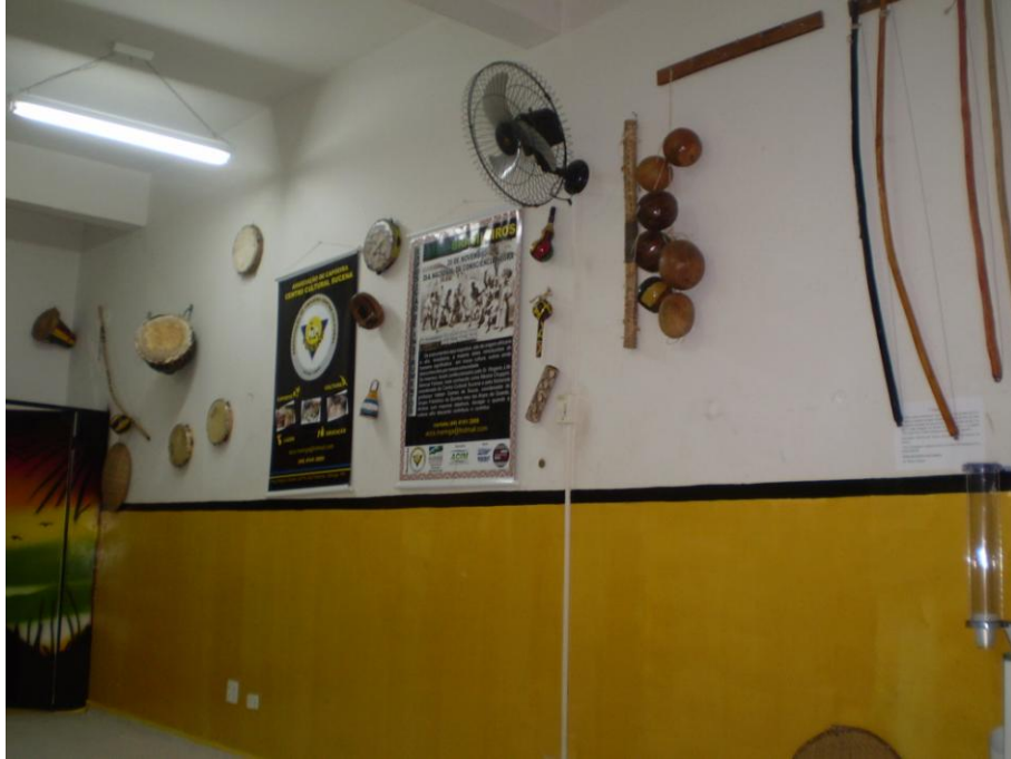
Figura 2. Parede direita de quem entra na Associação, na qual pode-se observar os instrumentos e painéis dispostos.