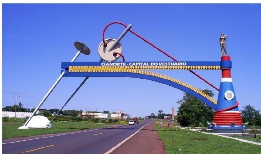
Figura 08 - Portal da moda de Cianorte

Ao analisar o papel da moda para a cidade de Cianorte, observa-se a representatividade das indústrias de confecção para seu desenvolvimento econômico e cultural. O portal de entrada da cidade, inaugurado no ano de 2006, divulga símbolos icônicos da indústria do vestuário, o que reafirma ainda mais a vocação local. Situado na rodovia PR-323, o primeiro e único Portal da Moda do Paraná exigiu em torno de R$ 500.000,00 para ser concluído e é uma iniciativa da administração municipal, em parceria com o Ministério do Turismo. O projeto é do arquiteto cianortense Luiz Herrera que elaborou um grande cone, com um zíper aberto cruzando a rodovia, sustentado por uma agulha e um alfinete e em toda a extensão uma linha, utensílios que simbolizam a maior prática profissional da região e um manequim simbolizando todos trabalhadores do setor (PREFEITURA DE CIANORTE, 2013).