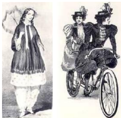
Figura 02 - Calça Bloomer/ variação da calça para prática do ciclismo