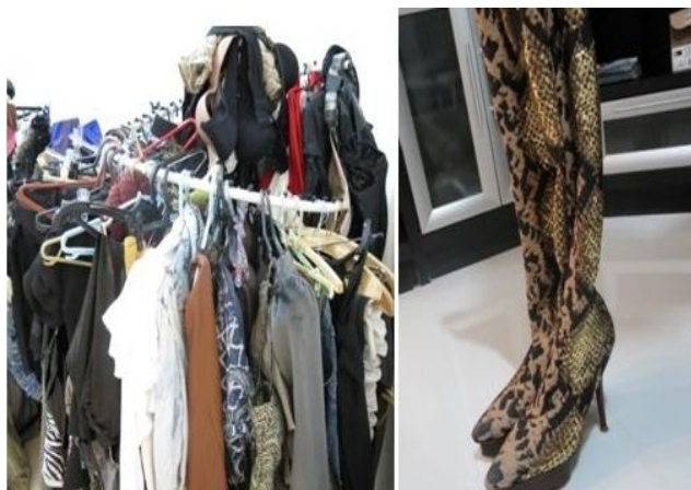
Figura 14 - Arara de roupa/ calçado preferido de Silvana