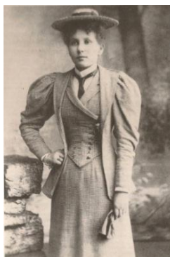
Figura 03 - Estilo 'alternativo'. Inglaterra, 1893

Crane (2006) informa que, nessa época, foi criado um estilo utilizado por todas as classes sociais, denominado 'alternativo', que extraía itens do vestuário masculino e modificava sutilmente o efeito do traje feminino. Tinha na gravata um ícone que constituía, num sentido mais geral, uma expressão de independência, um contraponto à condição da mulher e às transformações nas estruturas sociais daquele momento. Códigos e discursos do vestuário alternativo proporcionaram um meio da mulher se expressar e negligenciar a moda vigente. As mulheres nesse período desenvolveram seu próprio estilo de comunicação através do vestuário e essa forma alternativa foi assimilada, mesmo que lentamente. No final desse século, na Inglaterra e nos EUA, a 'mulher independente e forte' havia-se tornado a 'nova mulher' de grande visibilidade na educação, nos esportes e na força de trabalho. Na França, mudanças significativas nos direitos legais e nas oportunidades de emprego para elas também começaram a ocorrer.