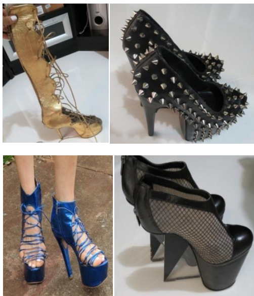
Figura 12 – Acervo de calçados da Silvana, criados juntamente com estilistas