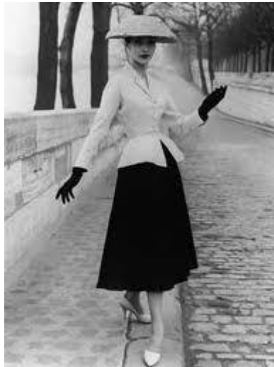
Figura 05 - Modelo new look - Christian Dior

estilista francês Christian Dior, idealizador do new look 6 em 1945, sugeria visões que desviavam a atenção da crise que o mundo vivenciava.