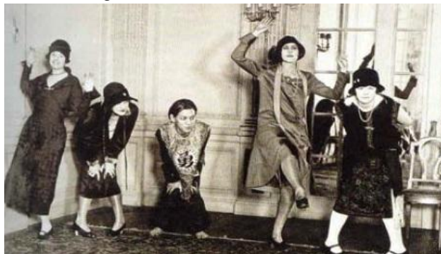
Figura 04 - Moda dos anos 20