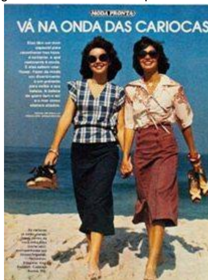
Figura 07 - Revista Manequim de 1970