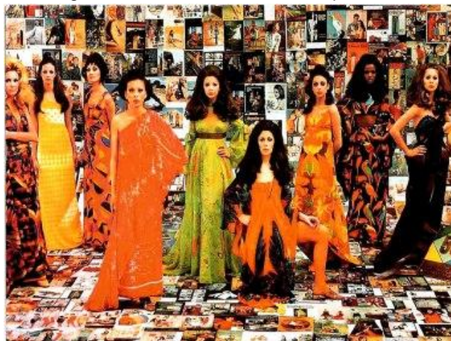
Figura 06 - Desfiles Rhodia – Tropicália